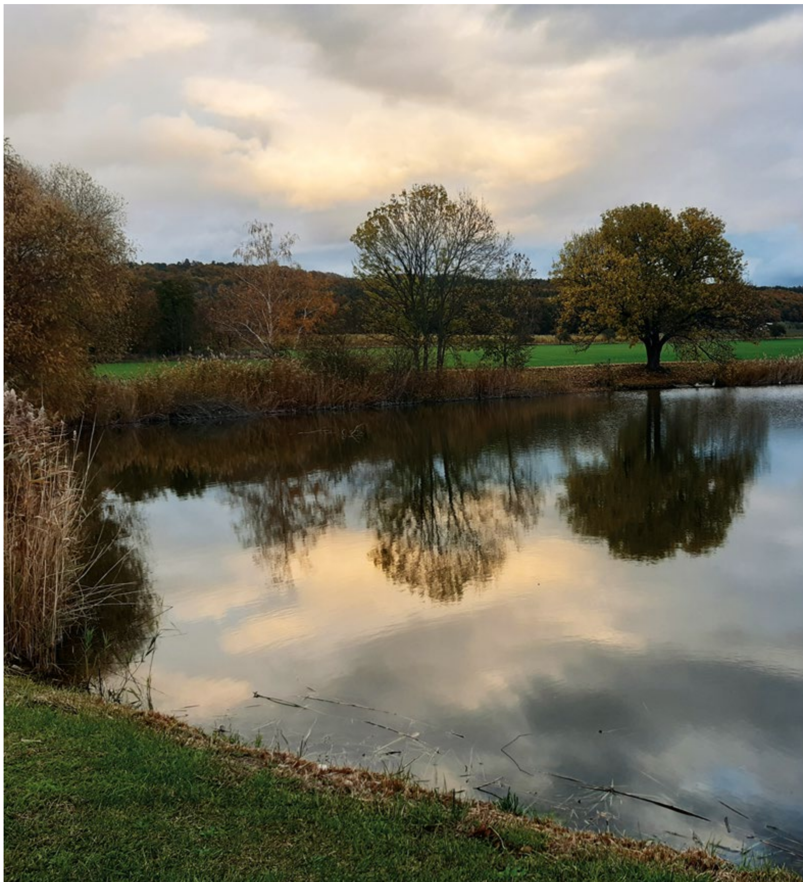
Obr. 11. Koukalecký rybník v současnosti (listopad 2023) Fig. 11. Current state of Koukalecký pond (November 2023)