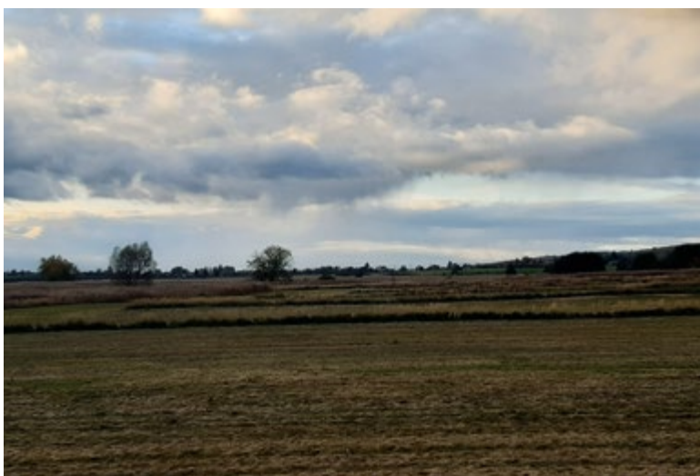
Obr. 13. Současná krajina na místě zaniklého Bramborského rybníka (listopad 2023)

Fig. 12. Current state of the landscape at the site of the disappeared Horecký pond (November 2023)