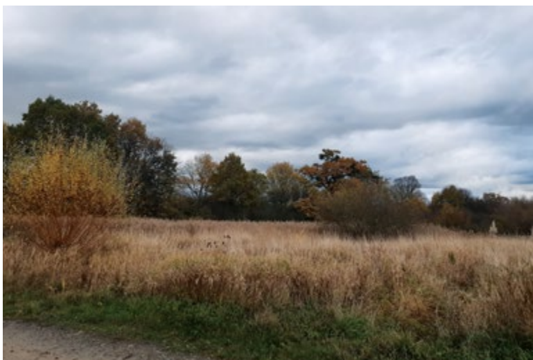
Obr. 12. Současná krajina v lokalitě zaniklého Horeckého rybníka (listopad 2023)

Příspěvek vznikl v rámci řešení interního grantu VÚV TGM č. 3600.54.03/2022 „Voda v krajině jako indikátor změn území v Polabské nížině“ a v rámci výzkumu Centra pro krajinu a biodiverzitu (projekt č. SS02030018, podporovaný Technologickou agenturou ČR).