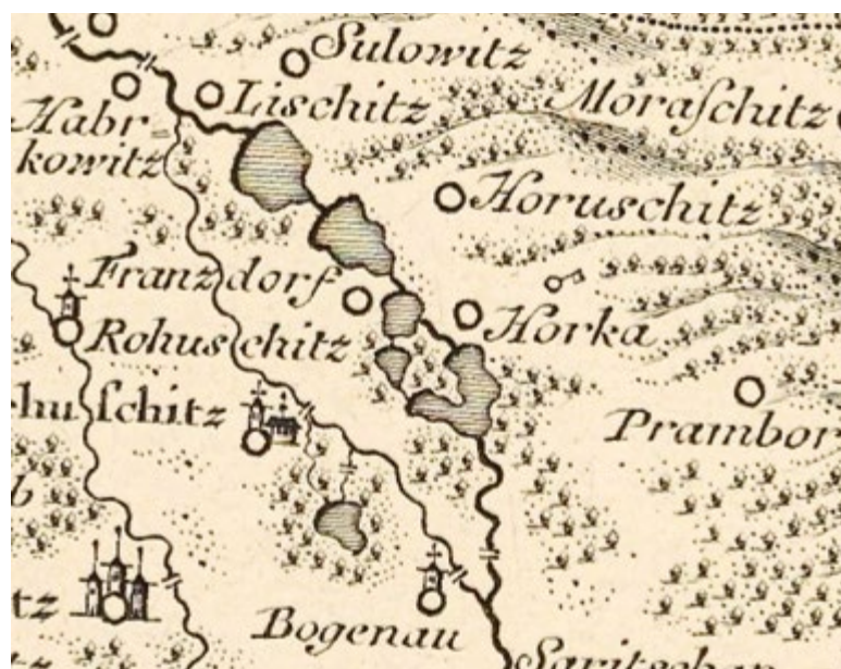
Obr. 5. Zobrazení rybníční soustavy na dolním toku Doubravy na Müllerově mapě Čech Fig. 5. Pond system on the lower Doubrava river, Müller's map of Bohemia

Na Müllerově mapě Čech je znázorněna soustava pěti rybníků na Čertovce. Jde o rybník Horecký, Borecký, Taušek, Světlov a Kmotrov. Zákres na této mapě je však oproti zákresu na mapě I. vojenského mapování odlišný, tvar rybníků Světlov a Horecký se velmi liší a prostorová lokalizace není zcela přesná. Také zde není zaznamenaný celý vodní tok Čertovka, ale pouze ta část, nacházející se za soutokem s kanálem, jenž napájí rybníční soustavu. Tato část – včetně kanálu – je zanesena jako hlavní tok a řeka Doubrava je zakreslena slabší linkou. Na levém břehu Doubravy je zobrazen rybník Kravinec (obr. 5).