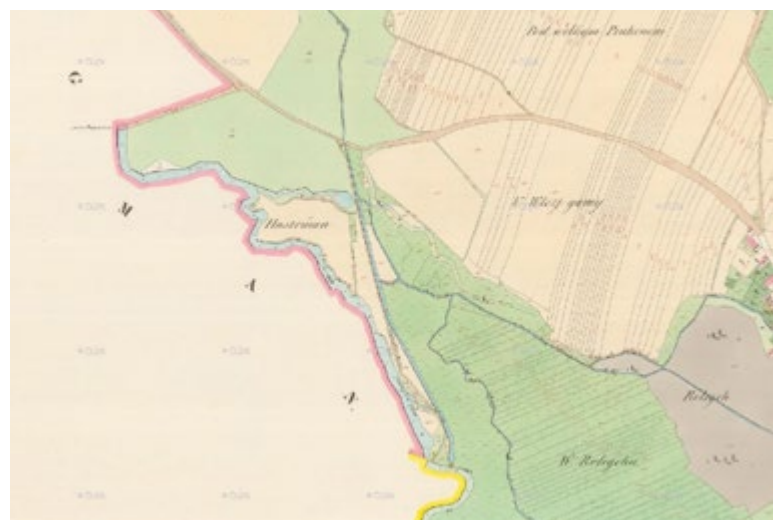
Obr. 6. Zobrazení lokality Hastman na Císařském otisku stabilního katastru Fig. 6. The Hastman site on a Imperial Inprint of the Stable Cadastre