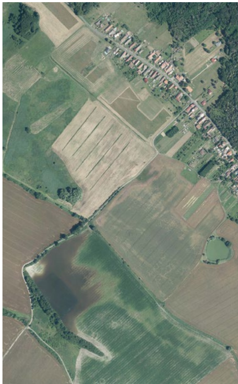
Obr. 14. Současná krajina v lokalitě Koukaleckého rybníka a zaniklých rybníků Bramborského a Horeckého (podmáčená lokalita v dolní části snímku) na Ortofotomapě ČR

Fig. 13. Current state of the landscape at the site of the disappeared Bramborský pond (November 2023)