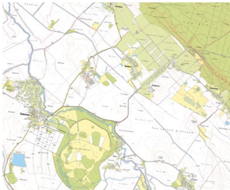
Obr. 3. Zobrazení současné krajiny na místě zaniklé rybníční soustavy na dolním toku Doubravy na ZM 10

Fig. 3. Current state of the landscape around the disappeared pond system in the lower Doubrava river, current BM 10