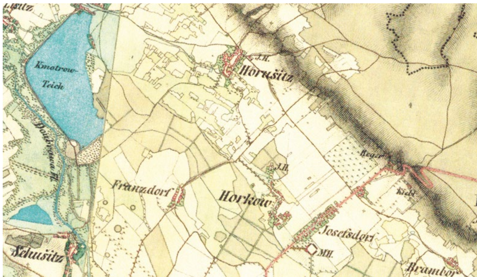
Obr. 2. Zobrazení rybníků Kmotrov a Šibeniční na místě zaniklé rybníční soustavy na dolním toku Doubravy na mapě II. vojenského mapování

Fig. 1. Pond system in the lower Doubrava river, 1st military mapping