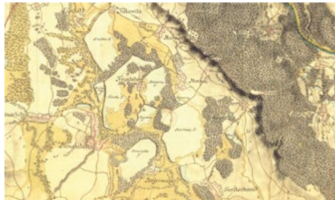
Obr. 1. Zobrazení rybníční soustavy na dolním toku Doubravy na mapě I. vojenského mapování

Rybníční soustava na dolním toku Doubravy ležela na vodním toku Čertovka a z Doubravy byla napájena soustavou kanálů. Na mapě I. vojenského mapování byla zaznamenána tato soustava, včetně názvů rybníků. Byly to rybníky Bojmanský, Podolský, Bramborský, Horecký, Dvorský, Borecký, Taušek, Světlov, Babický a Kmotrov. Dále zde byly bez uvedení názvu zakresleny menší rybníky Koukalecký a rybník v obci Horka. Na levém břehu Doubravy se pak nalézaly rybníky Kravinec, Šibeniční a malý rybník u zámku v Žehušicích (obr. 1 a 4).