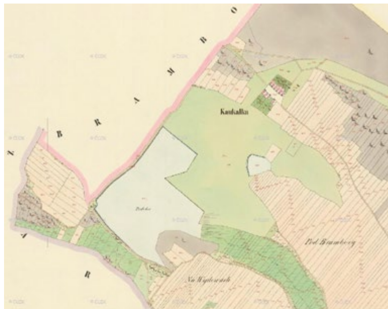
Obr. 10. Zobrazení Podolského a Koukaleckého rybníka na Císařském otisku stabilního katastru

Zaniklým rybníkům na základě interpretace archivních map se věnoval David [18]. Šlo o oblasti Blatenska, Třeboňska, Blanicka a Kouřimska. Potenciálem obnovy vodních ploch zaznamenaných na mapě I. vojenského mapování se zabývali Havlíček et al. [19]. Na základě analýzy tří povodí (Bystřice, Jevišovky a Opavy) bylo zjištěno, že největší potenciál obnovy vodních ploch z tohoto období je v povodí Jevišovky, kde byla téměř u 51 % zaniklých vodních ploch evidována dochovaná hráz či její větší část. Ostatní dvě povodí vykazují menší potenciál pro obnovu zaniklých vodních ploch, 26 % pro povodí Opavy a 24 % pro povodí Bystřice. V řešeném území zaniklé rybníční soustavy na dolním toku Doubravy a Čertovky jsou z hlavních rybníků v krajině též patrné dochované hráze. Nicméně obnova rybníků v původní rozloze není možná, neboť na části jejich plochy je již zastavěné území, případně se zástavba rozšířila do bezprostřední blízkosti historické lokalizace rybníků. Navíc lokalita zaniklého rybníka Kravinec se nachází na území přírodní památky Žehušická obora. Podle dochovaných zpráv však tyto rozlehlé zaniklé rybníky byly převážně mělké a velmi zabahněné, a vytvářely tak spíše močály [2, 20].