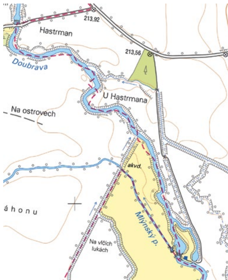
Obr. 7. Zobrazení lokality Hastrman na ZM 10 Fig. 7. The Hastrman site on current BM 10

Na obr. 15 je pak zachycen současný stav na místě zaniklého Boreckého rybníka včetně kanalizovaného vodního toku Čertovka.