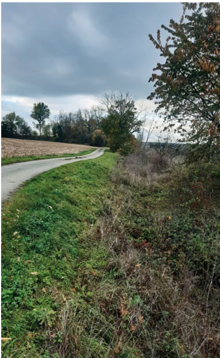
Obr. 9. Dochovaný úsek kanálu pro napájení zaniklé rybníční soustavy (listopad 2023), na ZM 10 označen jako občasný tok

Vývoj rybníční soustavy na dolním toku Doubravy byl též zaznamenán v rámci hodnocení vývoje vodního hospodářství na Čáslavsku [2]. Nicméně zde