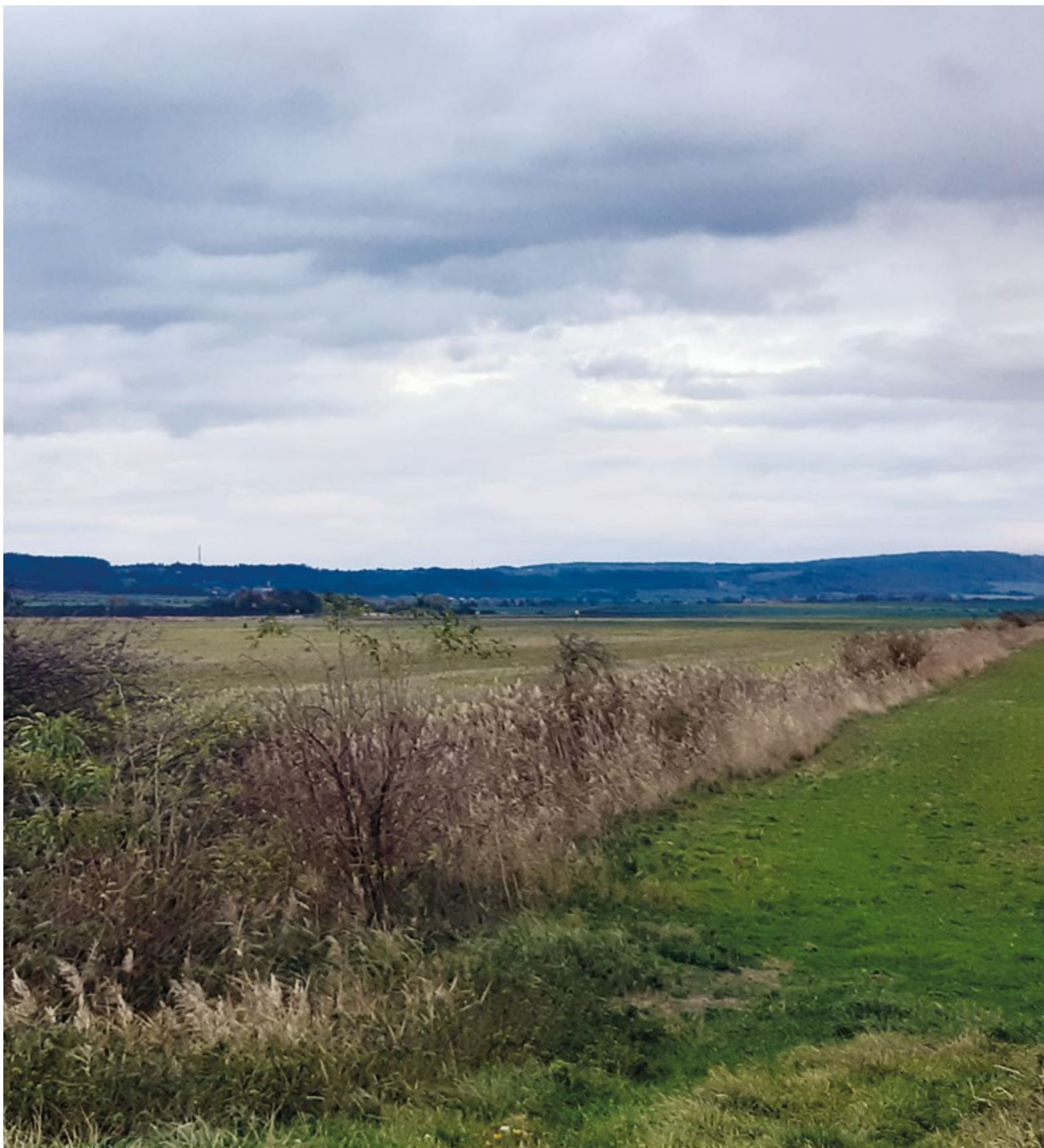
Obr. 15. Současná krajina včetně vodního toku Čertovka na místě zaniklého Boreckého rybníka (listopad 2023)

Fig. 15. Current state of the landscape including the Čertovka stream at the site of the disappeared Borecký pond (November 2023)