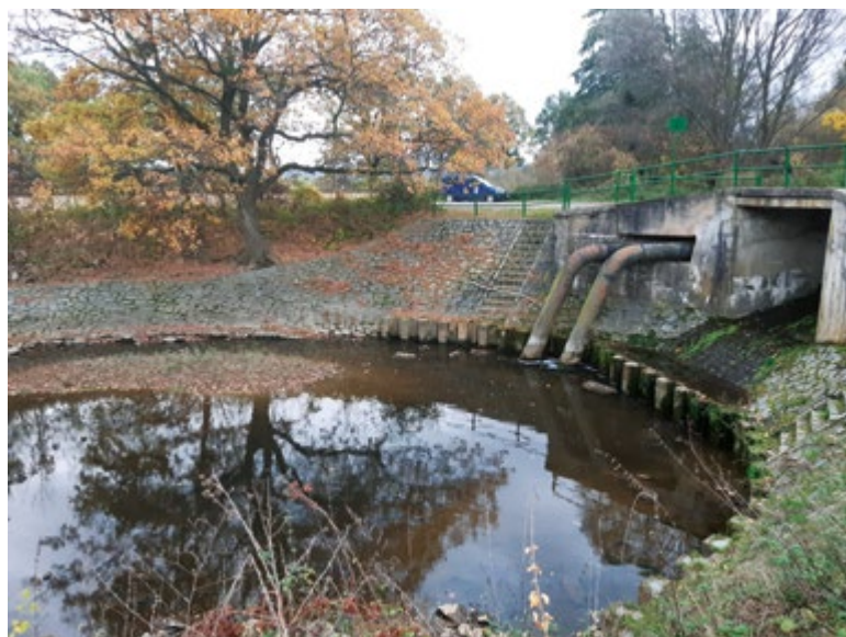
Obr. 8. Současná situace před jezem Bojmany u přepadu pro kanál, který sloužil pro napájení zaniklé rybníční soustavy a nyní se za jezem vrací zpět do Doubravy (listopad 2023)

Na Müllerově mapě Čech je zakreslena soustava pěti rybníků na Čertovce, zatímco na mapě I. vojenského mapování je jich na Čertovce sedm, nicméně dva z nich jsou menší rozlohy. Zákres tvaru rybníků na Müllerově mapě se však oproti zákresu na mapě I. vojenského mapování liší a prostorová lokalizace není zcela přesná.