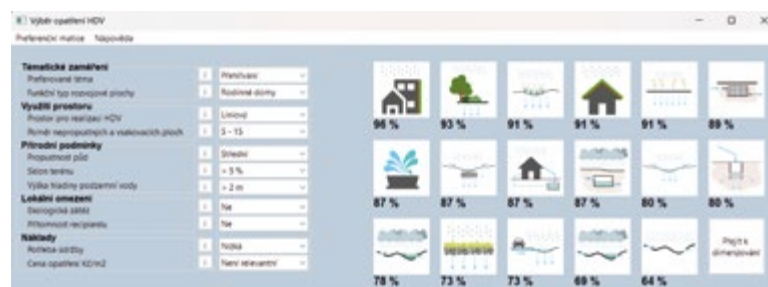
Obr. 2. Prezentace výsledků MCA v modulu „Výběr opatření“ Fig. 2. Presentation of MCA results in the "Measure selection" module

Výsledky MCA jsou uživateli demonstrovány grafickou a numerickou formou. Každému opatření je v rámci RWM přidělen piktogram. Piktogramy jsou řazeny sestupně na základě dosaženého bodového skóre z MCA. Relativní hodnota skóre (max. 100 %) je pak uvedena pod příslušným piktogramem. Prezentace výsledků MCA v okně „Výběr opatření“ je uvedena na obr. 2. Po kliknutí na piktogram je uživateli zobrazen detailní popis konkrétního opatření HDV a jeho aplikace v praxi.