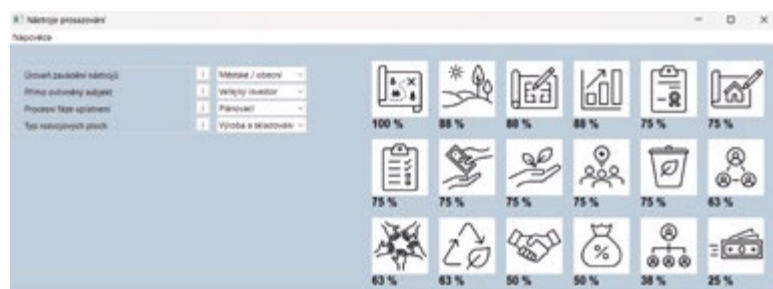
Obr. 4. Grafická podoba modulu „Prosazování opatření“

Modul „Prosazování opatření“ je primárně určen pro zástupce z řad veřejné správy. Jde o přehled nástrojů, které lze využít k podpoře a prosazování účinného hospodaření se srážkovou vodou v městských a obecních rozvojových lokalitách. Jednotlivé nástroje jsou založeny na zveřejněných obecných seznamech nástrojů a jejich specifikacích. Jsou kategorizovány dle hierarchické úrovně veřejné správy, dotčeného subjektu a fáze procesu (plánování, implementace, provoz). Cílem je nalezení nejvhodnějšího nástroje pro danou situaci. Celkově je zpracováno 18 typů nástrojů rozdělených do pěti kategorií (normativní; koncepční; koordinační a organizační; ekonomické; dobrovolné a etické) [16]. Pro výběr nástroje je opět využito metody MCA [11, 12]. Kritéria MCA jsou stanovena na základě volby odpovědí (celkem 17 možných odpovědí) na čtyři výchozí otázky. Prezentace výsledků je obdobná jako u modulu „Výběr opatření“. Také zde je možné přes kliknutí na piktogram přejít na detail daného nástroje. Grafická podoba modulu „Prosazování opatření“ je na obr. 4.