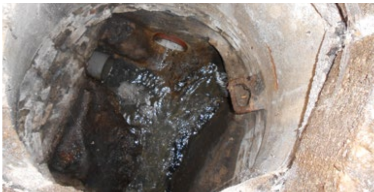
Obr. 2. Ilustrativní záběr odběrového místa na kanalizační přípojce

Pro pilotní projekt byly vybrány čtyři školy z Prahy a jejího blízkého okolí – dvě základní školy a dvě gymnázia. Odběry byly realizovány na výtoku splaškových vod ze sledovaného objektu (kanalizační přípojce), v jednom případě byla zvolena dvě odběrová místa z důvodů uspořádání dané školy. Na obr. 2 je ilustrativní záběr odběrového místa. Odběry probíhaly v červnu a v září nebo říjnu roku 2022. Šlo o bodové odběry, které byly prováděny ráno po otevření školy před začátkem vyučování mezi 7:30 a 8:05 a o tzv. velké přestávce, tj. v 9:30–10:00, ev. 10:30–11:00. Vzorky byly bezprostředně po odběru převezeny do laboratoře a uloženy do chladničky při teplotě 4–8 °C; pokud nebylo možno je zpracovat do 48 hodin po odběru, byly až do vlastní analýzy uchovávány zmrazené na teplotu -20 °C.