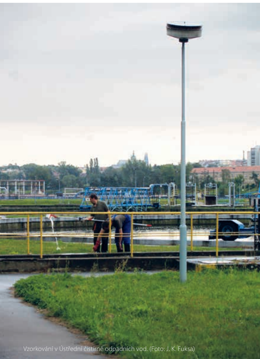
Vzorkování v Ústřední čistírně odpadních vod.