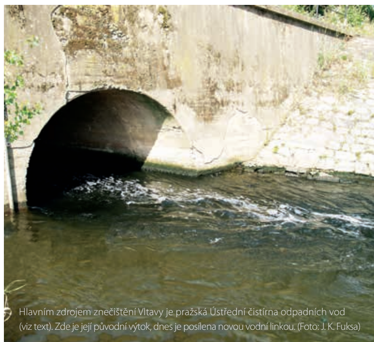
Hlavním zdrojem znečištění Vltavy je pražská Ústřední čistírna odpadních vod (viz text). Zde je její původní výtok, dnes je posílena novou vodní linkou.

Praha je potenciálně největším zdrojem znečištění Vltavy a po soutoku i českého úseku Labe. Pokusili jsme se proto tento zdroj posoudit objektivně, na základě dostupných dat o jakosti vody v dolní Vltavě a v dolním českém Labi, tedy v úseku mezi profily Podolí a Zelčín (Vltava nad Prahou a nad soutokem) a Obříství (Labe nad soutokem) a profilem Hřensko/Schmilka (Labe na státních hranicích). Základem textu je stejnojmenný příspěvek prezentovaný na XX. ročníku Magdeburského semináře [1]. Vltava i Labe mají na soutoku přibližně stejný dlouhodobý průměrný průtok, ale podstatně se liší velikostí povodí, při stejné hustotě osídlení jeho strukturou, lokalizací průmyslu i morfologií řeky a říční