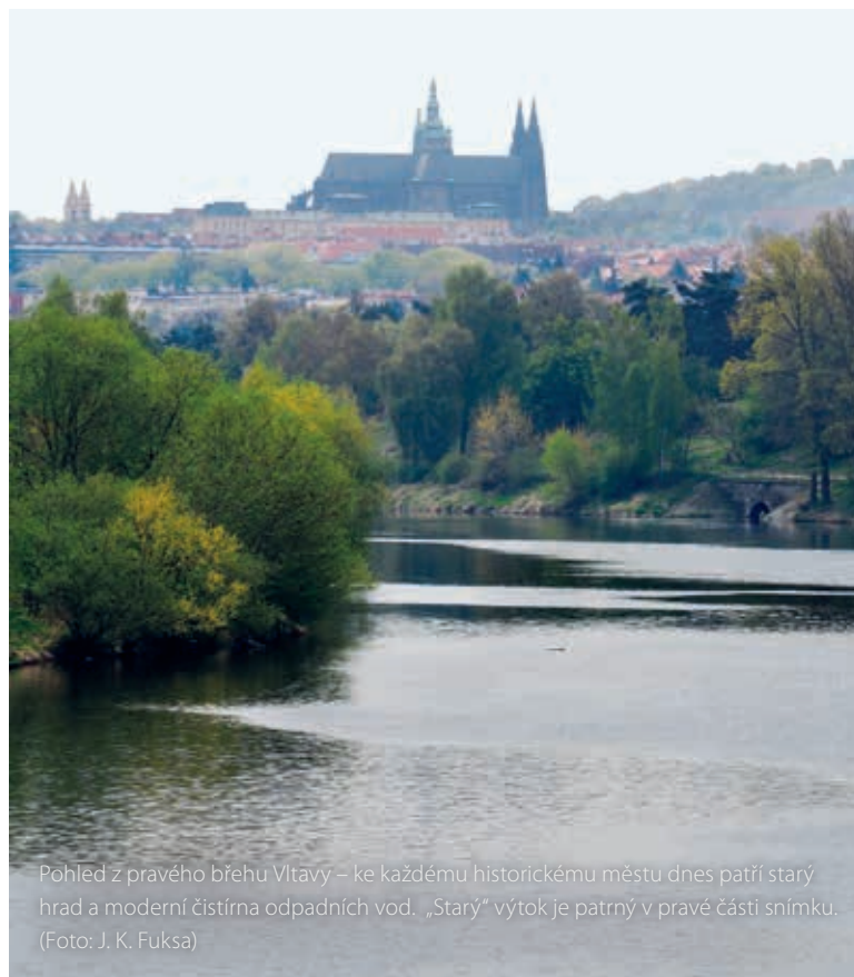
Pohled z pravého břehu Vltavy – ke každému historickému městu dnes patří starý hrad a moderní čistírna odpadních vod. „Starý“ výtok je patrný v pravé části snímku.