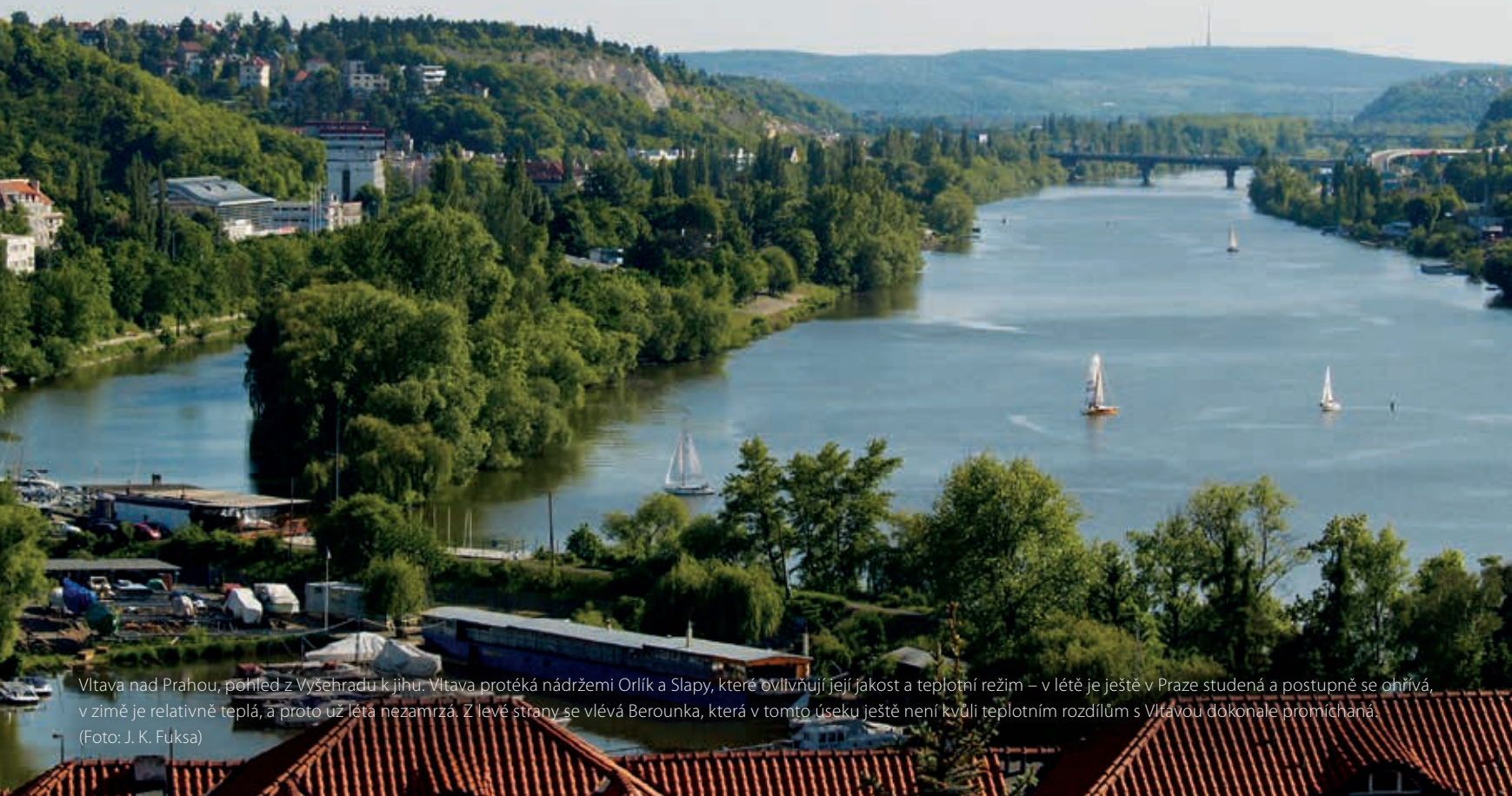
Vltava nad Prahou, pohled z Vyšehradu k jihu. Vltava protéká nádržemi Orlík a Slapy, které ovlivňují její jakost a teplotní režim – v létě je ještě v Praze studená a postupně se ohřívá, v zimě je relativně teplá, a proto už léta nezamrzá. Z levé strany se vlévá Berounka, která v tomto úseku ještě není kvůli teplotním rozdílům s Vltavou dokonale promíchána.

Novým problémem jsou specifické polutanty – vedle pesticidů především farmaka. Jejich spotřebu lze jen obtížně omezovat. Jejich přísun do toků je dán pouze tím, co po použití a vyloučení projde kanalizací přes čistírny do řek. Z grafů na obr. 3 je patrné, že Praha je významný zdroj znečištění farmaky, ale že řada látek sem již přichází z povodí. Cca 30 % dlouhodobého průtoku Prahou přichází z Berounky a Sázavy. Uvážíme-li na úseku Vltavy nad Prahou ještě teoretické doby zdržení ve Vltavské kaskádě (Orlík cca 99 dnů, Slapy cca 37 dnů), je rezistence metforminu, gabapentinu, oxipurinolu (metabolit alopurinolu) atd. pozoruhodná. Teoretické doby zdržení lze ovšem pro odhad vlivu na rychlost postupu látek po proudu použít jen obecně, protože platí pouze pro dlouhodobý průměrný průtok plnou a nestratifikovanou nádrží. Reálně se voda z přítoku zařazuje do stratifikované nádrže podle aktuálních teplot/hustot a jednotlivé vrstvy postupují odděleně (podle vypouštění k turbínám). Objem Orlíku navíc během suchých let kolísá podle dotace průtoku Prahou, což reálnou dobu zdržení dále zkracuje.