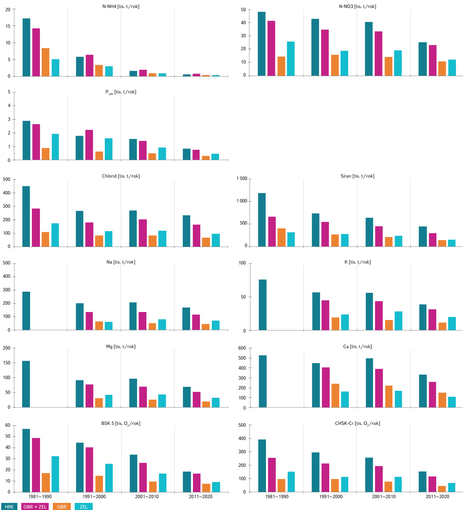
Obr. 2. Desetileté průměry hodnot látkového transportu měřnými profily v tis. tunách/rok; druhý sloupec je součet transportu Labem a Vltavou nad soutokem Fig. 2. Ten-years means of transport through monitored profiles in thousand tons per year; second column represents the sum of transport/supply by Elbe and Vltava at the confluence