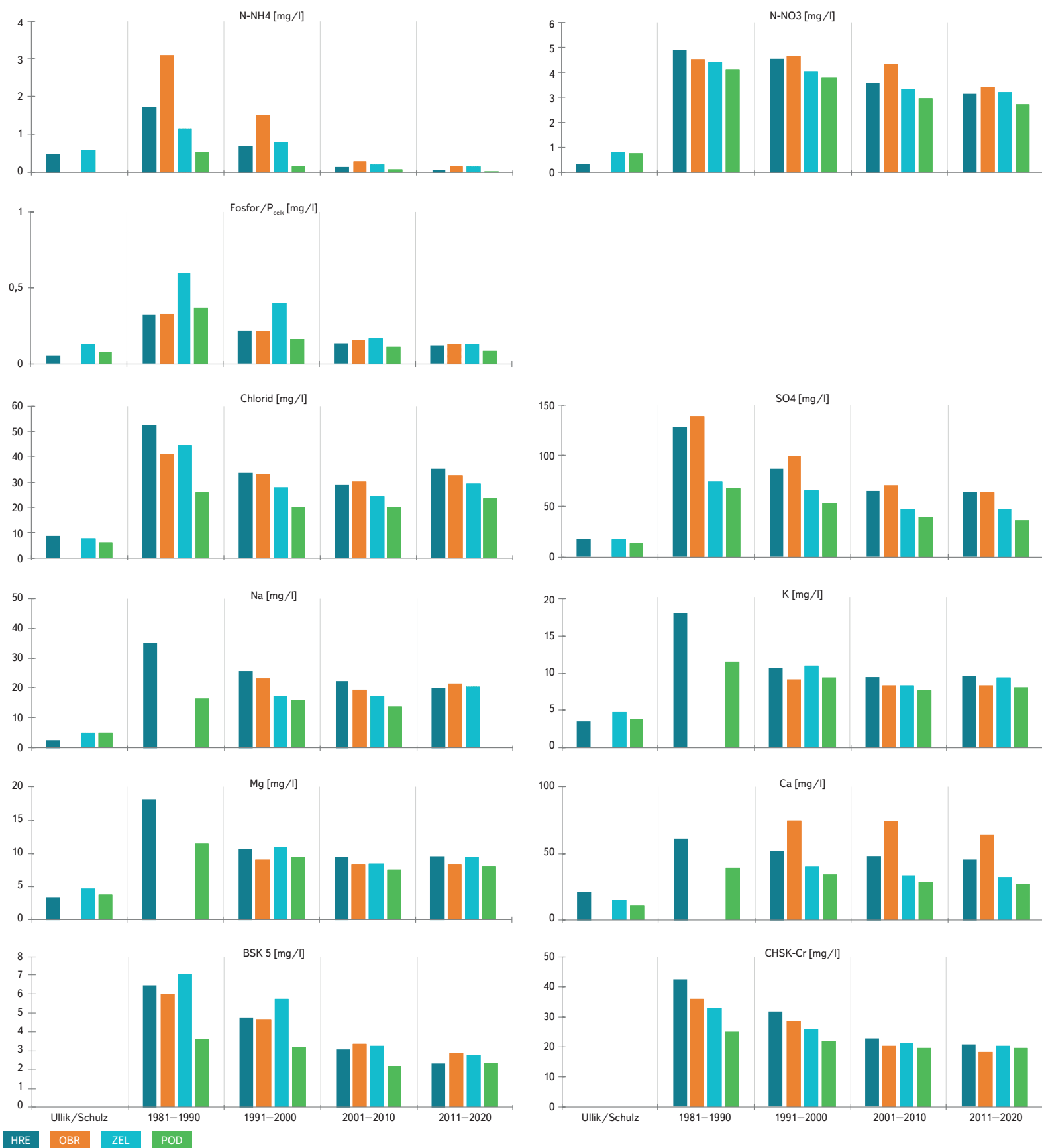
Obr. 1. Koncentrace ukazatelů znečištění – desetileté průměry; levé sloupce jsou průměry z dat Ullika (Labe – Děčín, 1877) a Schulze (Vltava pod Prahou, 1913)