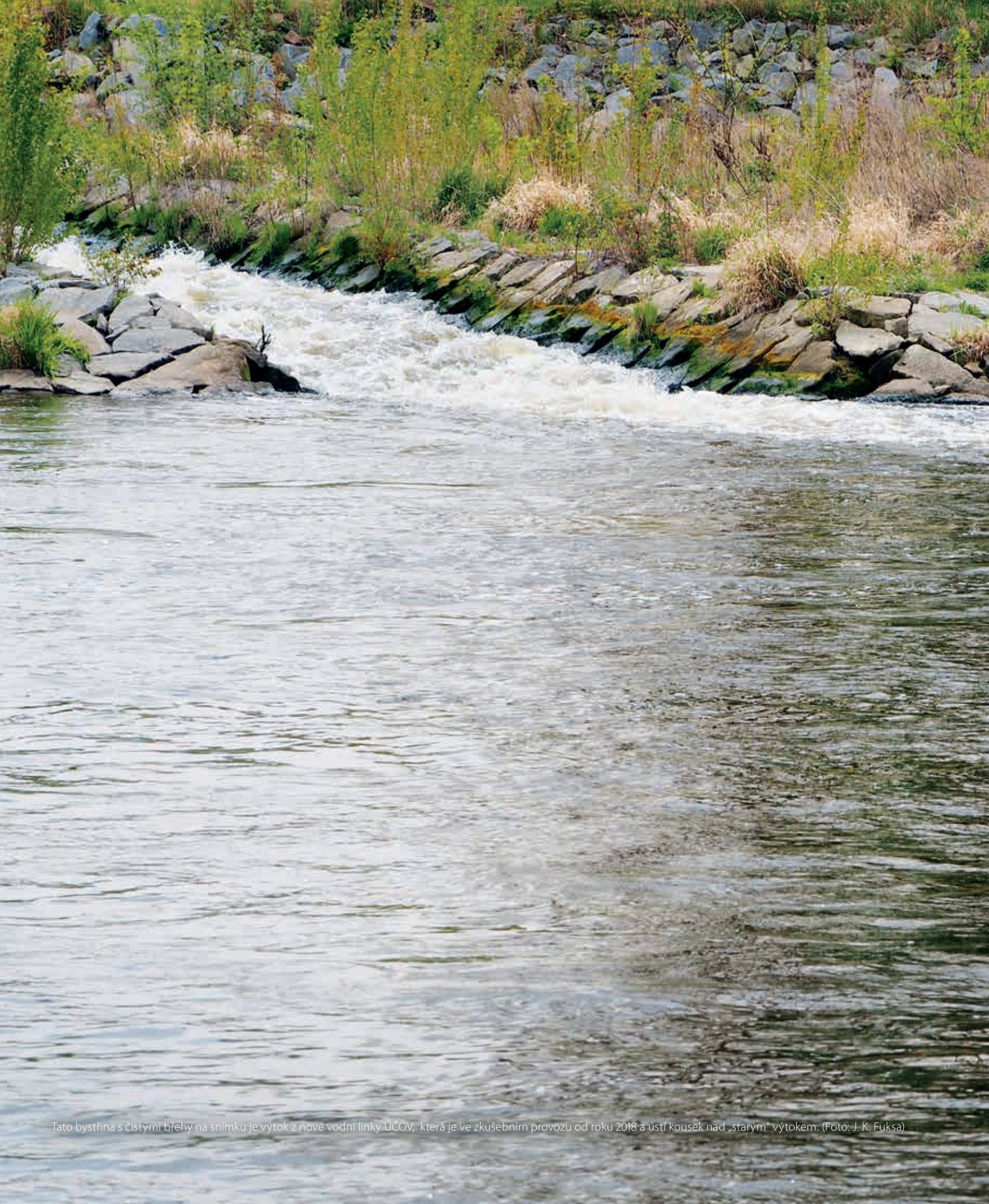
Tato bystřina s čistými břehy na snímku je výtok z nové vodní linky ÚČOV, která je ve zkušebním provozu od roku 2018 a ústí kousek nad „starým“ výtokem.