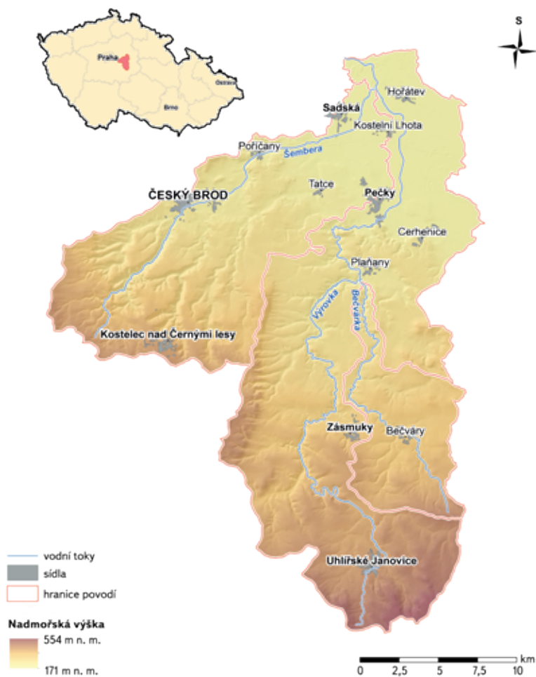
Obr. 1. Povodí 3. řádu Výrovka z hlediska hydrologie a nadmořské výšky – zdroj dat [8] Fig. 1. The 3 rd order Výrovka river basin in terms of hydrology and altitude – data source [8]