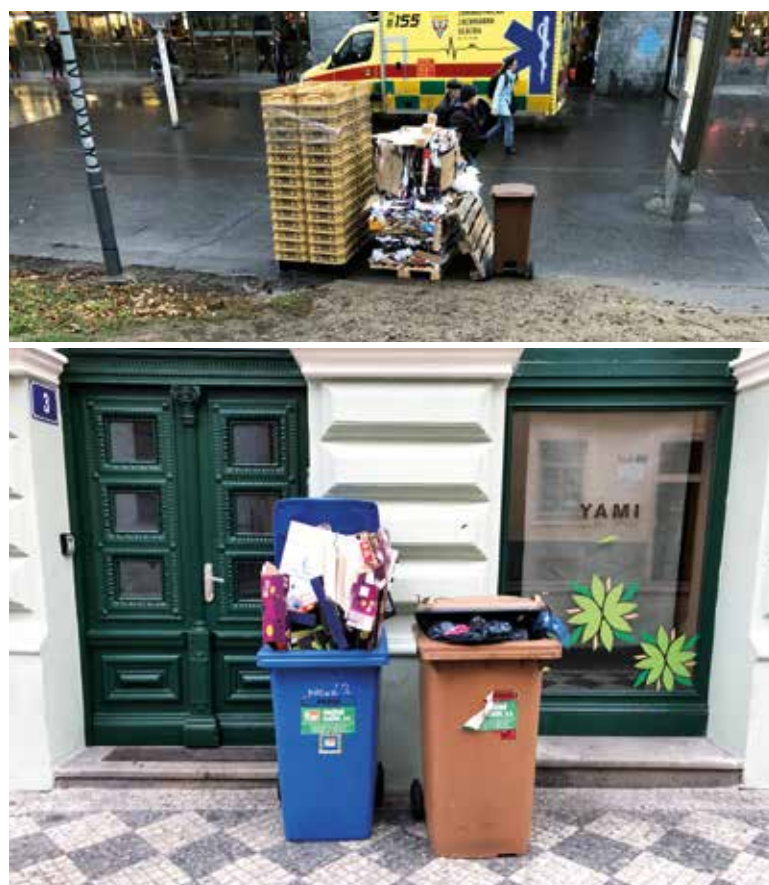
Obr. 2. Tříděný papír od právnické osoby Fig. 2. Sorted paper from a legal entity/businessmen

Praha 1 (P1) je díky území Pražské památkové rezervace specifická. Kromě veřejně dostupných KH je přibližně 1 000 sběrných míst umístěno přímo v bytových domech. Jedná se o kontejnery o objemu 0,12–0,24 m 3 pro barevné sklo, papír a plast vyvážené 1x za 1–2 týdny. Při monitoringu nejsou tyto kontejnery evidovány z důvodu nedostupnosti. Při náhodné možnosti kontejner zkontrolovat lze konstatovat, že neanonymní separace je efektivní a mnohem čistější než veřejná anonymní. To také potvrzují i vně umístěné kontejnery (např. pro papír) uzamykatelné pro konkrétní právnické osoby/obchody (obr. 2). Objemný odpad lze odkládat na 12 místech, a to jeden den v každém měsíci [4]. Objemný odpad, jako např. elektrospotřebiče, lednice, sporáky, stavební suť, pneumatiky, lze odložit ve sběrném dvoře. Nejbližší je sběrný dvůr hlavního města Prahy v ulici Perucká (Praha-Vinohrady) [4], kam lze odložit i nebezpečné odpady. Biologicky rozložitelný odpad (BRO) je svážen velkoobjemovým kontejnerem jednou měsíčně z jednoho místa. Veřejně dostupný kontejner pro elektroodpad se nachází pouze v ulici Široká a Žitná. Pražské služby, a. s., zajišťují i svoz gastroodpadu [5, 6]. Veřejně dostupné kontejnery pro textil jsou umístěny na Senovážném náměstí a jejich provoz zajišťuje firma Potex [7].