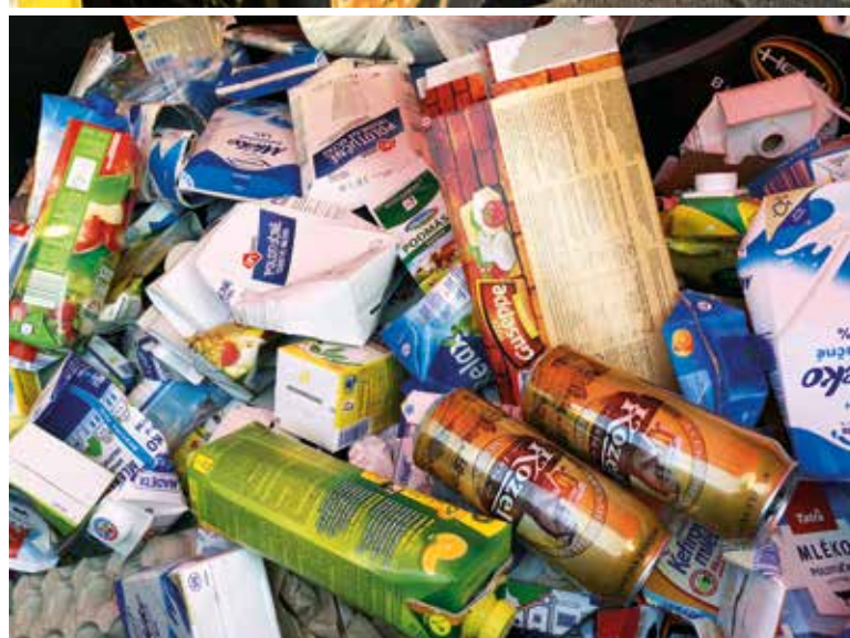
Obr. 6. Příměsi v kontejnerech pro nápojové obaly Fig. 6. Admixtures in containers of beverage packaging

Vilová zástavba je tvořena rodinnými domy s různě velkými soukromými zahradami, na kterých je vyprodukován ve větší míře i BRO. Většina domů není vytápěna tuhými palivy, tj. ve smíšeném komunálním odpadu se nenachází popel.