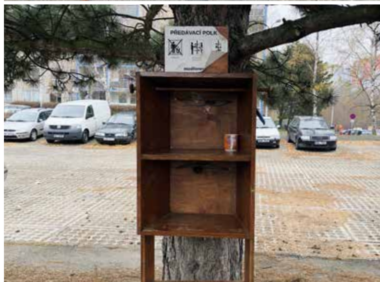
Obr. 9. Ponechávané potraviny k dalšímu využití; „Předávací budka“ Praha 12 sídliště Fig. 9. Preserved food for further use; “Transfer box” Prague 12 housing estate

pěče MHMP. Tato hlediska musí být v souladu s dostupností pro svozovou techniku. Nicméně obecně lze říci, že všechna KH jsou umístěna efektivně, zejména v místech frekventovaného výskytu obyvatel, tj. na trasách k parkovištím, obchodním centrům, centrům služeb, školních a zdravotních zařízení a na trasách k zastávkám MHD. Na některých místech (např. Veronské náměstí (P15)) jsou některé kontejnery nevyužitelné z důvodu špatné dostupnosti, ve vymezeném prostoru jsou nahuštěné na sebe tak, že je nelze otevřít.