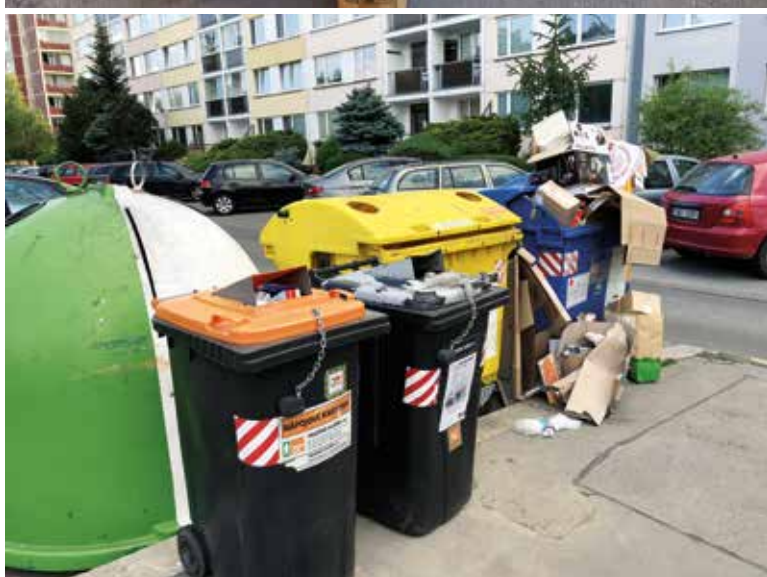
Obr. 5. Přeplněné kontejnery na papír – výběr Praha 15 Fig. 5. Crowded containers for paper waste – selection Prague 15

Sídlištní zástavbu představují sídliště s typickými panelovými domy z 80. a 90. let 20. století.