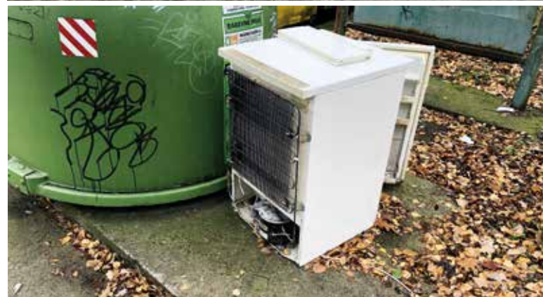
Obr. 3. Littering v blízkosti kontejnerových hnízd Fig. 3. Littering near container nests