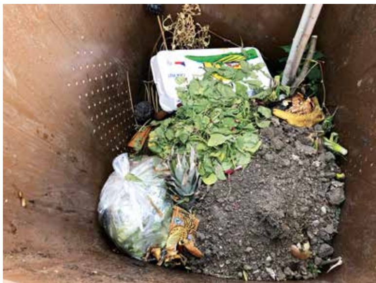
Obr. 7. Bioodpad s příměsí jiných odpadů Fig. 7. Biowaste with admixture of other waste