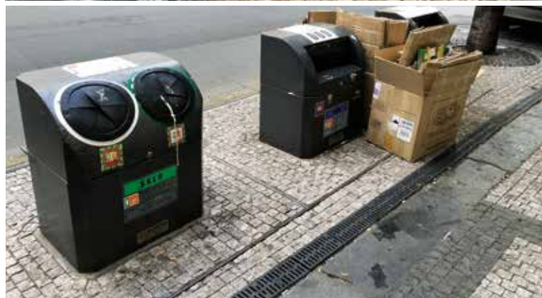
Obr. 4. Přehněné kontejnery – výběr Praha 1 ul. Rytířská a Masná Fig. 4. Crowded containers – selection Prague 1 Rytířská and Masná street